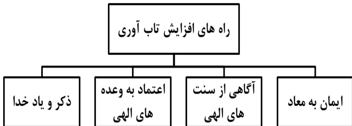
شکل ۲ راه های بهبود تاب آوری